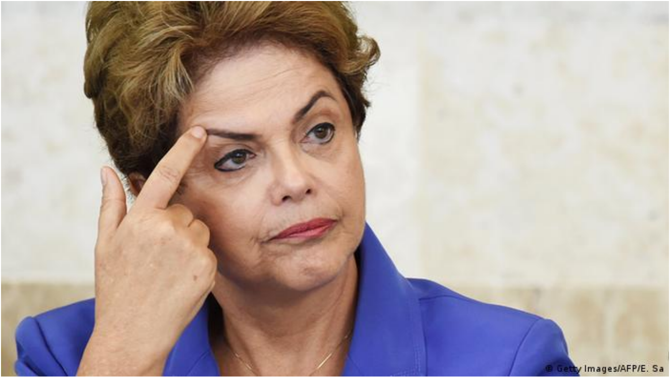
Presidente Dilma Rousseff

Dilma Rousseff, mesmo em repouso, tinha a capacidade deixar a equipe tensa. Jamais entendi isso (não fazia parte de sua equipe, mas assistia atônita). Eventos com ela não eram nossos preferidos.