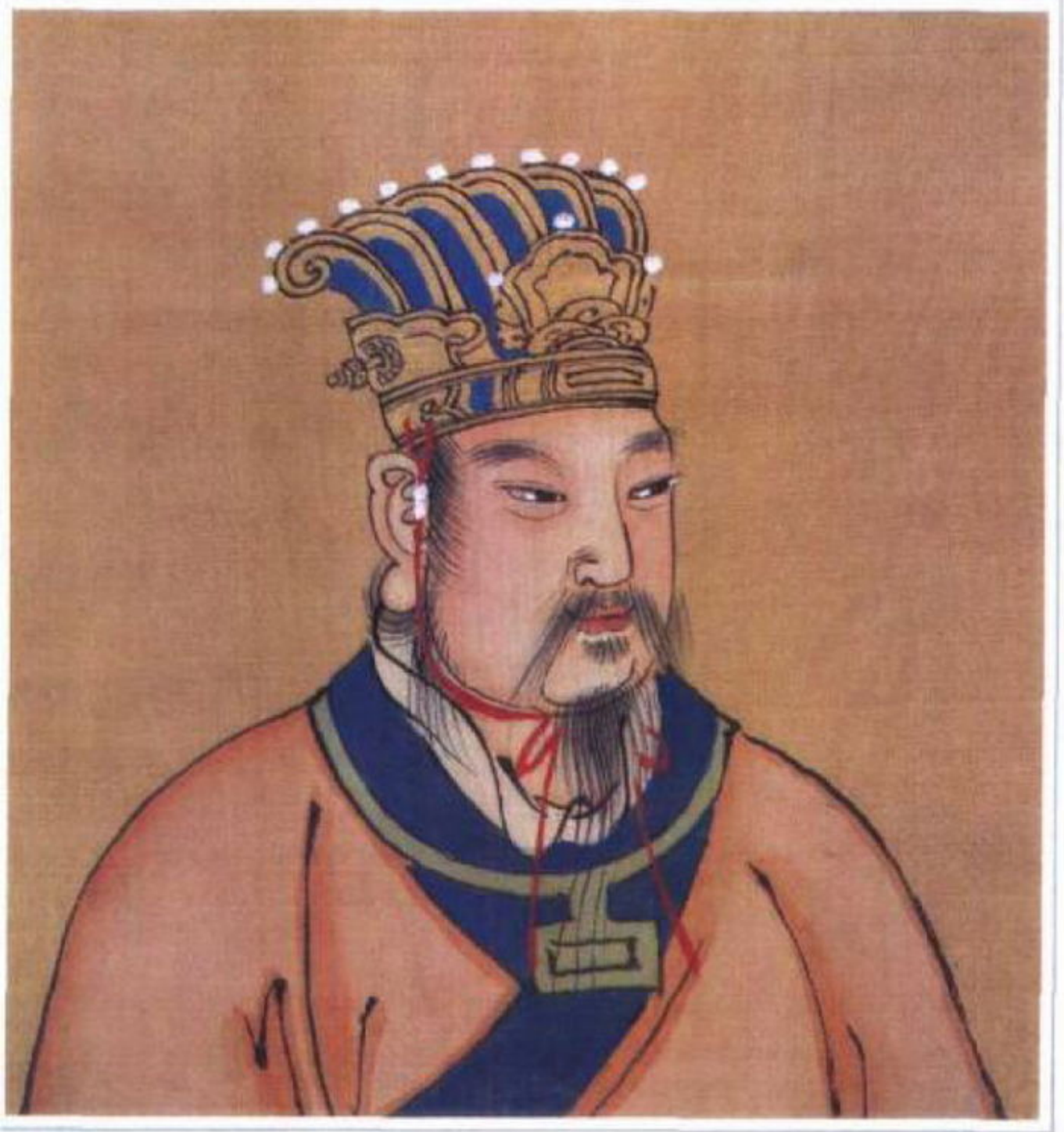
周文王 (? —前1046) 明人绘

Cerimonial – é a organização sequencial de qualquer evento seja ele político, social, acadêmico, esportivo ou empresarial. E tem sido, desde a antiguidade, uma das mais valorizadas maneiras encontradas pelos povos para se relacionarem uns com os outros. O escrito mais antigo é atribuído a Chou Kung , fundador da dinastia Chou da China no século XII a.C.