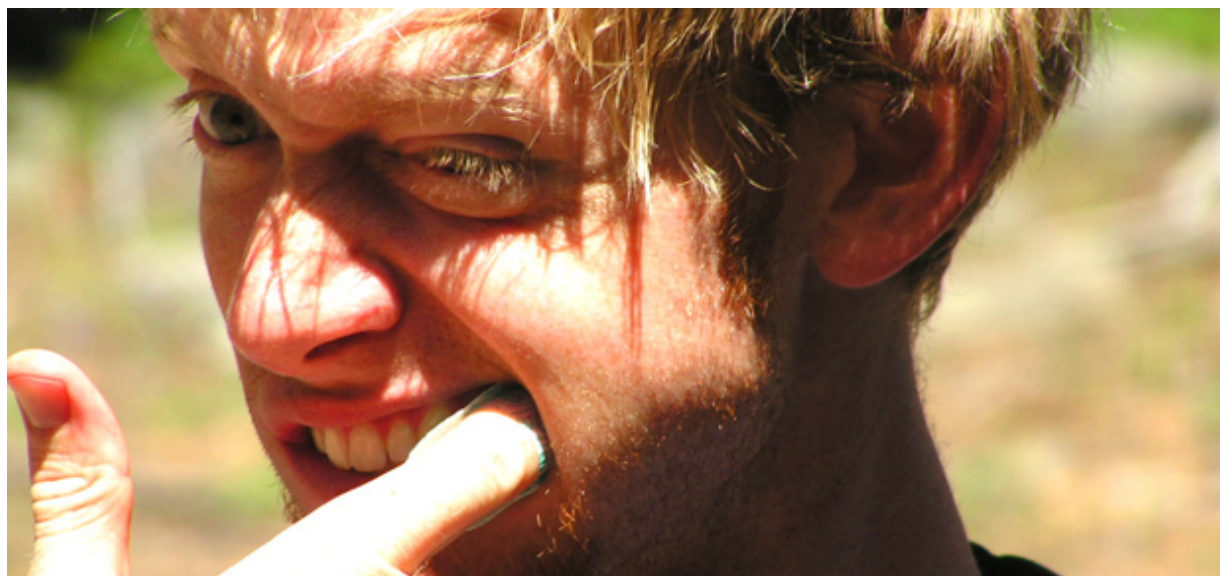
KONICA MINOLTA DIGITAL CAMERA

1- Limpar os dentes com o dedo – horrível né? Mas tem gente que faz isso na mesa de trabalho. E outro dia vi, (juro) no Coco Bambu de Fortaleza uma senhora toda bonitona passar o fio dental a dois metros da minha mesa e deixar o mesmo sobre o tampo!!! Enquanto levantava e desfilava rumo a saída... que tal?..